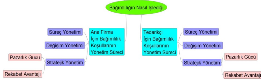
Şekil 2: Bağımlılığın Nasıl İşlediğine Yönelik Tema ve Kodların Gösterimi

Bağımlılık nasıl işlediğine ilişkin ikinci araştırma sorusu kapsamında ilişkinin her iki tarafı için de üç temel kod ortaya çıkmıştır. Bu kodlar; süreç yönetimi, değişim yönetimi ve stratejik yönetimdir .